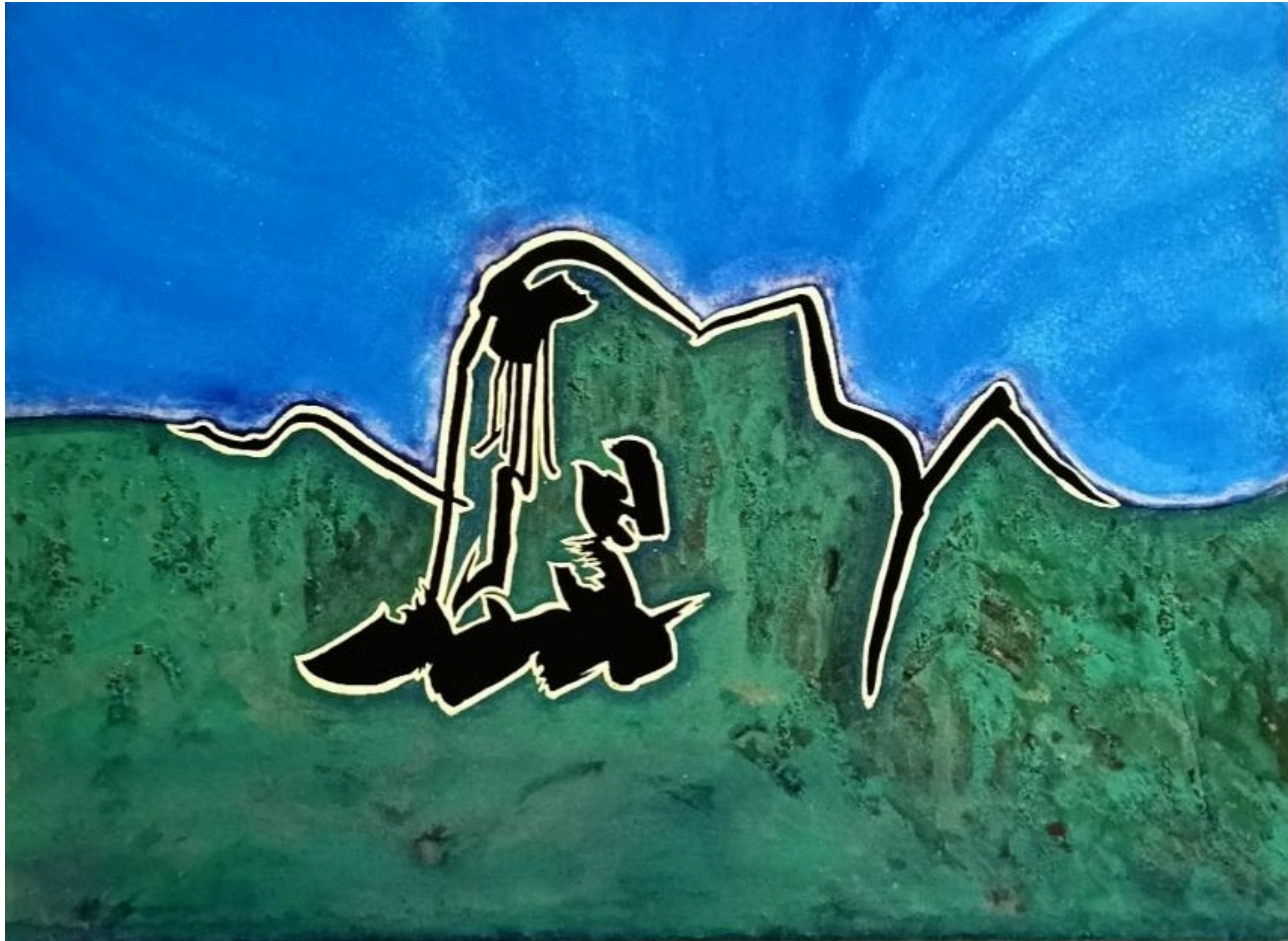
Mt.HAKUUN-MYOGI- 2026 297mm x 420mm

mineral pigments, pigments, the stones of Mt. Myogi, Kochi hemp paper, wooden panel