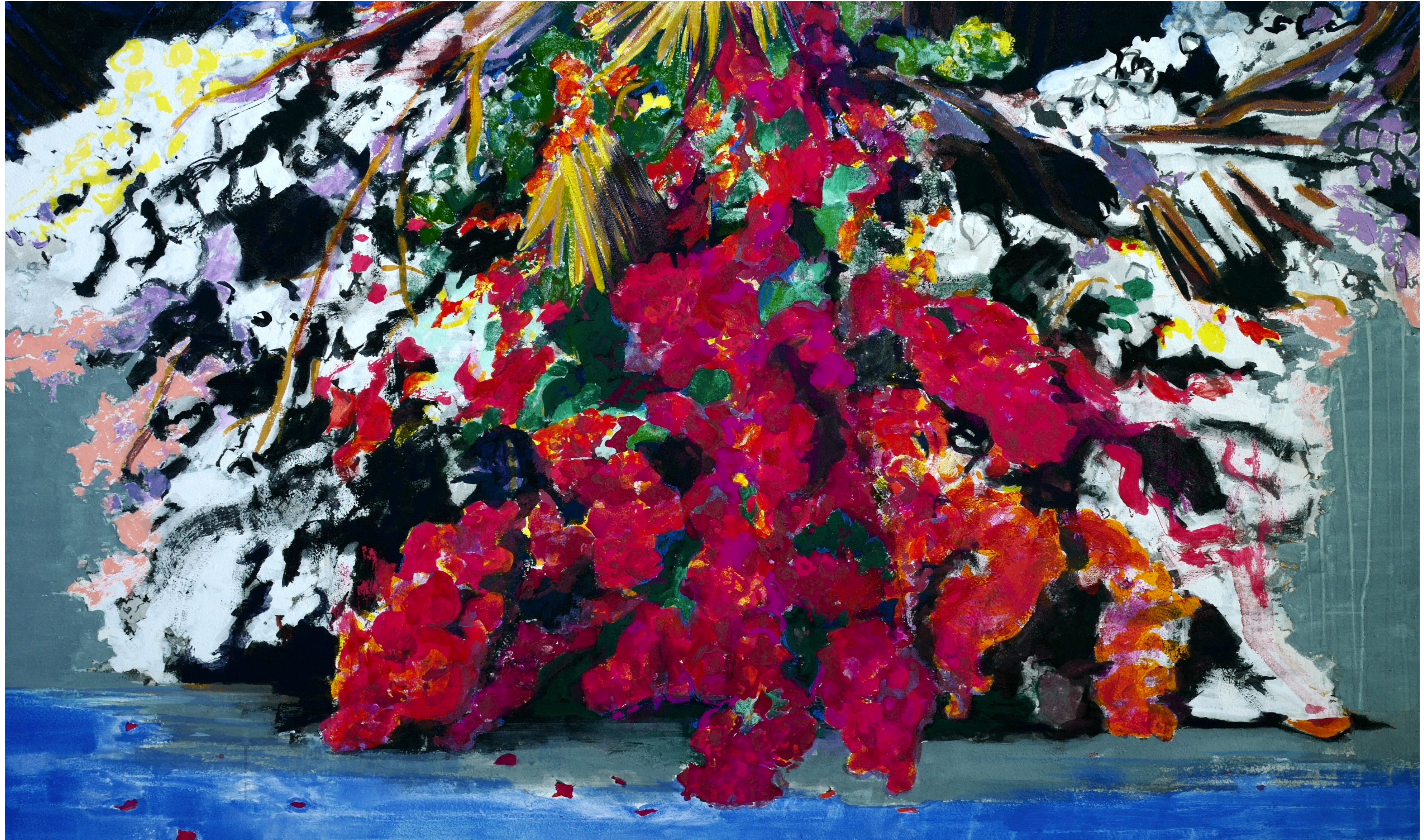
MAIKO in the Sway of the Tide 2025 M100/1620mm x 970mm mineral pigments, pigments, Kochi hemp paper, wooden panel